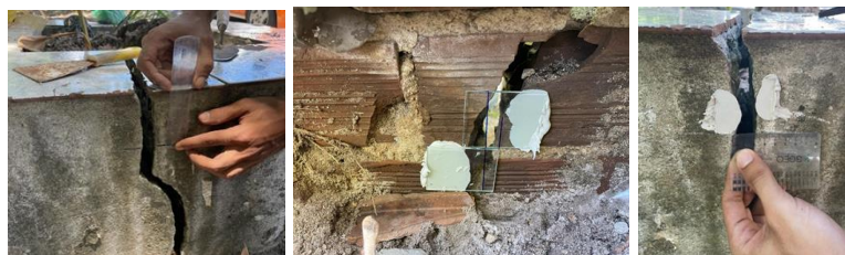
Figura 5. Instrumentação para o acompanhamento da movimentação de terra no talude do São José.

Dessa forma, através da parceria da UFPB com a Defesa Civil de João Pessoa, foi realizada a instrumentação da trinca por meio de um fissurômetro, conforme mostrado na Figura 5, permitindo medições sucessivas para o acompanhamento da movimentação do solo durante o período de maior intensidade pluviométrica na cidade de João Pessoa-PB, que corresponde aos meses de abril a julho.