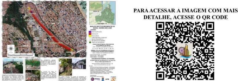
Figura 3. Mapa de Risco do bairro São José.

Soares e Pereira (2017). Os resultados dessas análises permitiram a classificação das zonas e a elaboração de mapas que destacam as áreas mais suscetíveis a deslizamentos de massa nesses bairros, conforme a Figura 3.