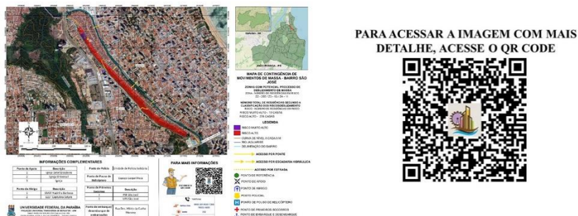
Figura 7. Mapa de Contingência do bairro São José.

Devido às características topográficas e territoriais do bairro São José, tornando-o de difícil acesso, foi elaborado, exclusivamente para esse bairro, um mapa de contingência, Figura 7, o qual irá apresentar, por meio de um mapeamento, as ações específicas a serem adotadas em caso de ocorrência de um movimento de massa. Essas ações incluem medidas de resposta imediata, recursos necessários, rotas de acesso/evacuação, locais de abrigo, pontos de apoio, comunicação de emergência, entre outros aspectos relevantes. As informações presentes no mapa são baseadas na análise de riscos e nos dados obtidos durante as etapas anteriores do processo de gestão de risco de movimento de massa na cidade de João Pessoa-PB.