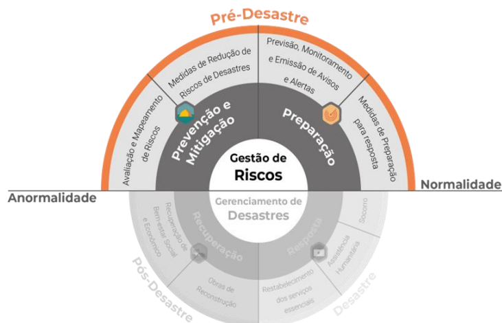
Figura 2. Ciclo de atuação da Defesa Civil.

De acordo com a Lei nº 12.608, de 10 de abril de 2012, e regulamentada pelo Decreto nº 10.593, de 24 de dezembro de 2020, a gestão de riscos de desastres compreende três etapas distintas e inter-relacionadas: prevenção, mitigação e preparação. Essas etapas podem ser visualizadas na Figura 2.