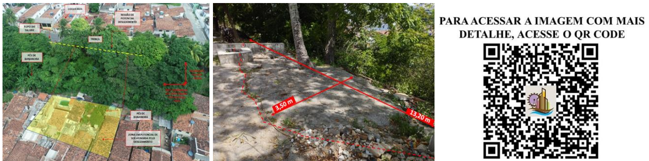
Figura 4. Trinca no talude do bairro São José.

Cada um dos bairros apresentou seus riscos característicos. No entanto, como exemplo para o presente estudo, o bairro São José apresentou a maior parte de sua área classificada como zona de Alto Risco de deslizamentos e, especificamente, devido a uma trinca em evolução na encosta do bairro, com comportamento sazonal ativo, classificou-se a zona como Muito Alto risco. Por se tratar de uma região de difícil acesso, com árvores de grande porte por toda extensão da encosta e residências nas proximidades do pé do talude, foi necessário um levantamento fotogramétrico com auxílio de um drone para melhor estudar a região, obtendo-se a Figura 4 como resultado.