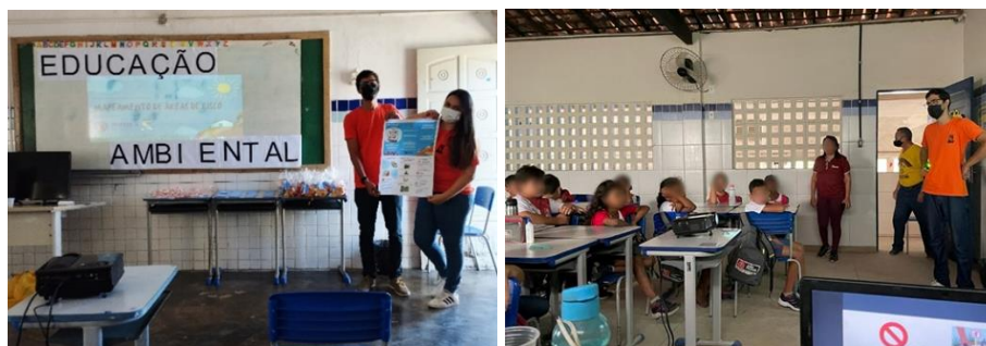
Figura 6. Educação Ambiental.

Essa iniciativa resultou no engajamento de aproximadamente 232 crianças e adolescentes, sendo 60 do São José, 65 do Alto do Mateus e 107 do Roger, contribuindo para aumentar a conscientização sobre os riscos e promover a adoção de práticas mais seguras, conforme ilustrado na Figura 6.