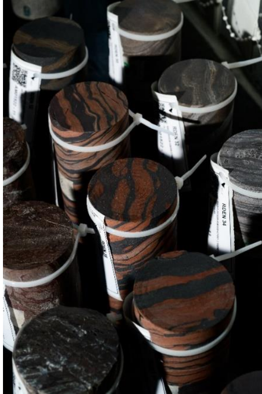
Figura 1- Corpos de prova após usinagem.

A etapa seguinte é a verificação da usinagem com paquímetro e relógio comparador e o agrupamento dos CP's (Figura 1). O agrupamento leva em consideração litologias com características geotécnicas similares (grau de resistência, grau de alteração, grau de fraturamento e descontinuidade principal).