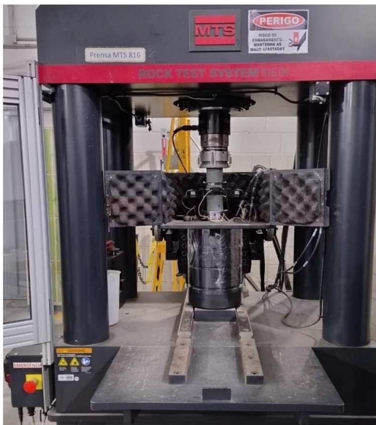
Figura 2 - Ensaio UCS com controle de deformação.

Os ensaios de compressão uniaxial podem ser executados por dois métodos distintos: A) Método em duas etapas: (1) Etapa com controle de deformação radial, até aproximadamente 50% da carga de ruptura, para determinação de parâmetros elásticos ou até a curva volumétrica torna-se assintota. (2) Etapa com controle de força até a ruptura do CP e B) Método em etapa única: controle de deformação radial até a ruptura.