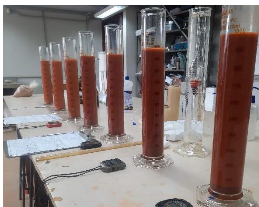
Figura 1. Ensaio de sedimentação em andamento

Para cada amostra seca ao ar, destorroada e passada na peneira #10 (2 mm), foram separadas quatro frações de 70 g ( \pm 0,1 ) que foram adicionadas a 125 mL das soluções com o defloculante. Após um período de 12 h, o material foi disperso a 10.000 rpm durante 15 min. Posteriormente, o material foi transferido para uma proveta com água destilada (completando-se o volume até 1.000 mL) e sendo agitado por um minuto (Figura 1). As leituras de densidade relativa e temperatura foram realizadas conforme os intervalos sugeridos pela norma brasileira NBR 7181 (ABNT, 2016).