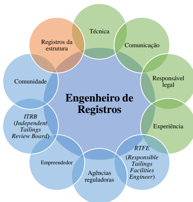
Figura 2. Ciclo de informações sobre gestão de TFSs. Fonte: GBA (2018). Adaptado pelos autores.

O papel do EdR é multifacetado, essencial e central para a gestão de segurança e sustentabilidade de uma instalação de rejeitos. Este profissional é o pilar central que sustenta várias áreas cruciais, como a expertise técnica no design e acompanhamento da estrutura, a comunicação estratégica com todas as partes interessadas, e a responsabilidade legal perante regulamentações e padrões da indústria (ilustrado na Figura 2). Com uma responsabilidade abrangente que vai desde a concepção até o fechamento da instalação, o EdR deve manter uma vigilância constante, garantindo que todas as fases do ciclo de vida da instalação estejam alinhadas com as melhores práticas e as expectativas dos stakeholders (GBA, 2018).