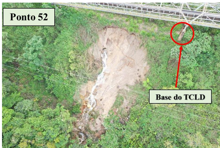
Figura 4. Exemplo da aplicação da metodologia de classificação dos riscos – Ponto 52.