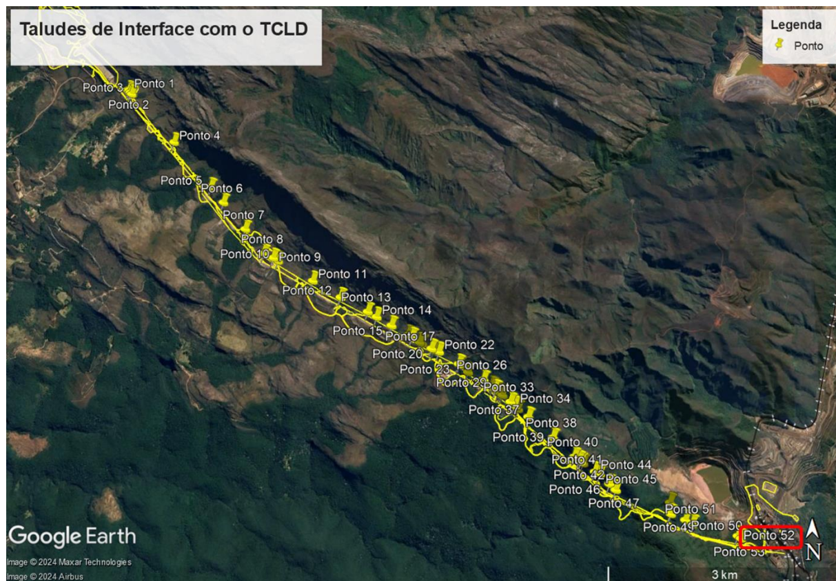
Figura 1. Taludes de interface com o TCLD, com destaque para o Ponto 52.